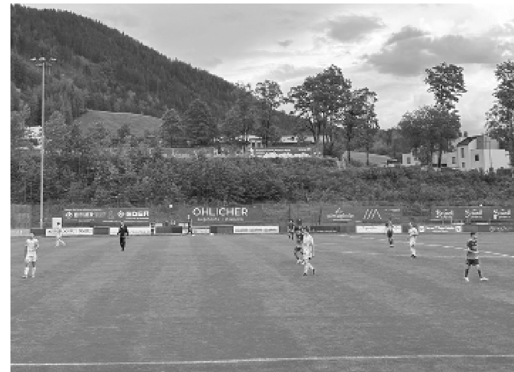
Ein spannendes Fußballspiel auf dem grünen Rasen, umgeben von idyllischer Landschaft und konzentrierten Spielern.

Fußball bei den Olympischen Spielen Fußball wurde 1900 in das Programm der Olympischen Spiele aufgenommen. Seitdem ist er eine der wenigen Mann-